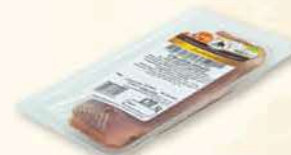
SZYNKA DOJRZEWAJĄCA 250 g