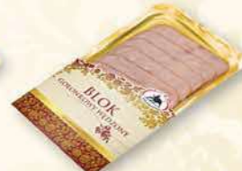
BŁOK GOLONKOWY WĘDZONY 120 g