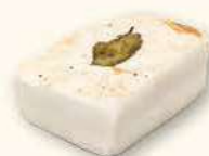
SŁONINA Z PRZYPAWAMI