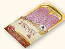
KRAKOWSKA SUCHA Z INDYKA 100 g