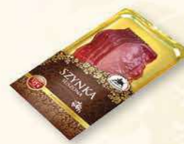
SZYNKĄ SUSZONA 100 g