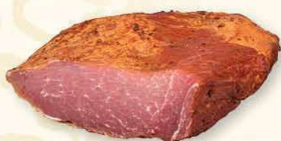
SZYŃSKA WIEPRZOWA DOJRZEWAJĄCA WĘDZONA