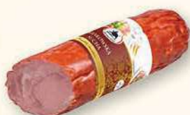
KIEŁBASA KRAKOWSKA SUCHA