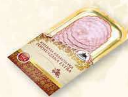
KRAKOWSKA PODSUSZANA 100 g