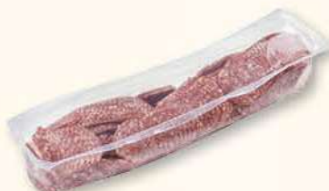
SALAMI CYGAŃSKIE 1 kg