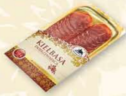
KIEŁBASA DOJRZEWAJĄCA 100 g