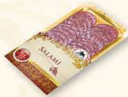
SALAMI CYGAŃSKIE 100 g