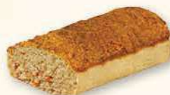
PASZTET Z INDYKIEM