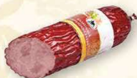
KIEŁBASA KRAKOWSKA PODSUSZANA EKSTRA