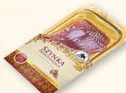
SZYNKĄ DOJRZEWAJĄCA 100 g