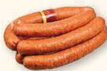
KIEŁBASA PODWAWELSKA ORYGINALNA