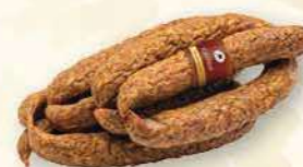
KIEŁBASA JAŁOWCOWA SWOJSKA