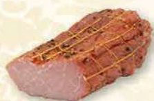
SZYŃKA ŁOSOSIOWA Z PIEPRZEM