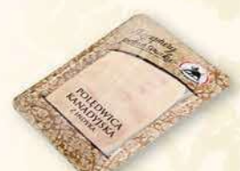
SZYNKĄ BIAŁĄ Z INDYKA 100 g