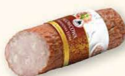
KIEŁBASA JAŁOWCOWA PODSUSZANA EKSTRA