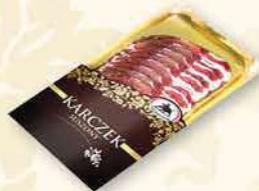
KARCZEK SUSZONY 100 g