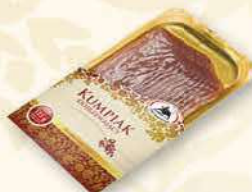
KUMPIAK 100 g