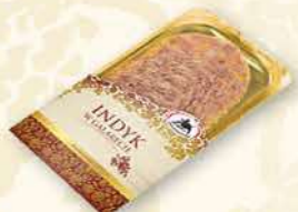
INDYK W GALARECIE 100 g