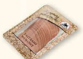
PASTRAMI WOŁOWE 100 g