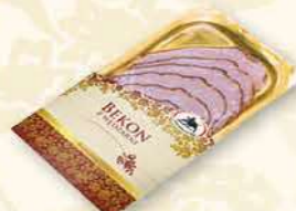
BEKON Z WĘDZARNI 100 g