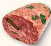
SALCESON Z OGÓRKIEM