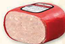
MIELONKA RODZINNA ŚNIADANIOWA 800 G