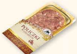
POLICZKI W GALARECIE 100 g