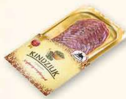
KINDZIUK Z PIEPRZEM 100 g