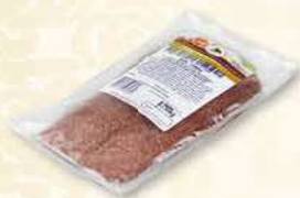
SALAMI CYGAŃSKIE 250 g