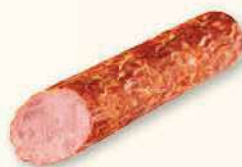
KRAKOWSKA PODSUSZANA Z INDYKIEM