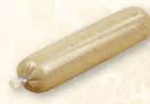
PASZTETOWA WIEPRZOWA 200 g