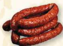
KIEŁBASA Z WĘDZARNI