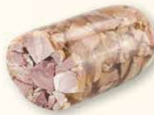
MIĘSIWO W GALARECIE