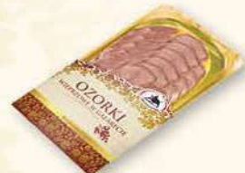
OZORKI W GALARECIE 100 g