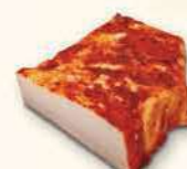
SŁONINA Z PAPRYKĄ