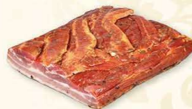
BOCZEK DOJRZEWAJĄCY WĘDZONY