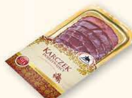
KARCZEK DOJRZEWAJĄCY 100 g