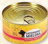
MIELONKA GATUNKOWA WIEPRZOWA 300 g