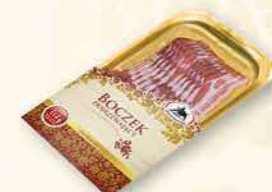
BOCZEK DOJRZEWAJĄCY 100 g