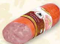
KIEŁBASA KRAKOWSKA PARZONA