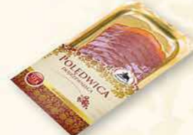
POLĘDWICA DOJRZEWAJĄCA 100 g