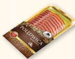
POLĘDWICA SUSZONA 100 g