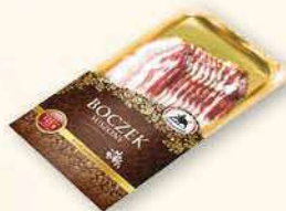
BOCZEK SUSZONY 100 g