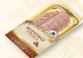
MIĘSIWO W GALARECIE 100 g