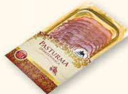
PASTURMA 100 g