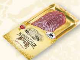
KINDZIUK 100 g