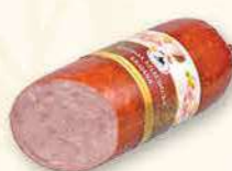
KIEŁBASA SZLACHECKA KRAJANA