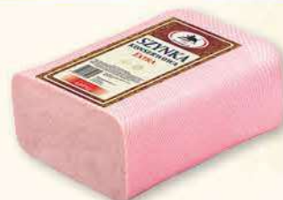
SZYNKA KONSERWOWA 11 lbs