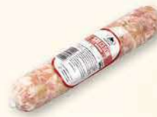
SALCESON KRESOWY 300 g