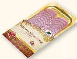
KRAKOWSKA SUCHA 100 g