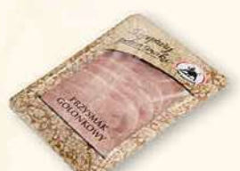
PRZYSMAK GOLONKOWY 80 g