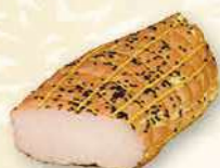
SZYŃKA Z CZARNUSZKĄ