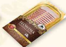
SŁONINA WĘDZONA EKSTRA 100 g