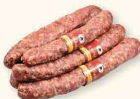
PALCÓWKA SUROWA DOJRZEWAJĄCA