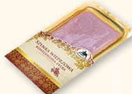
SZYNKĄ KONSERWOWA 150 g