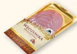
WĘDZONKA KROTOSZYŃSKA 130 g