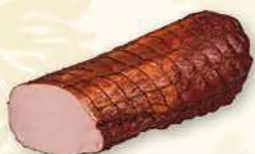
BEKON Z WĘDZARNI