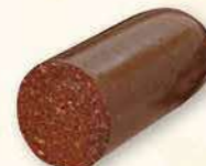
KASZANKA NA PATELNIĘ