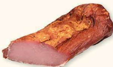
POLĘDWICA DOJRZEWAJĄCA WĘDZONA