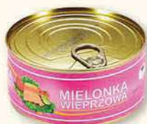
MIELONKA WIEPRZOWA 300 g