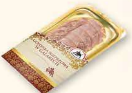
GOLONKA W GALARECIE 100 g