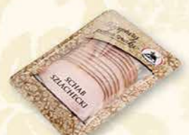
SCHAB SZLACHECKI 100 g