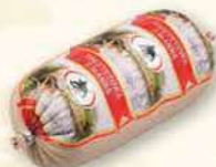
PASZTETOWA Z MANNĄ